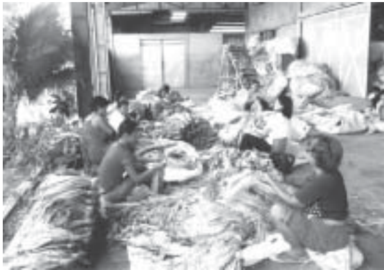
(写真2) 乾燥葉タバコの仕分け作業 (イロコス・スール州)