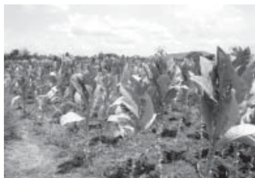
（写真1） 葉タバコの栽培 （イロコス・スール州）

コ会社の子会社であり、紙巻タバコの原料工場でもある。ここでは荷受直後に、今度は親会社規定したより細かな等級基準に従い再々区分される。次いで紙巻タバコの製造前段階である、加工 再乾燥 熟成を経て、二年后に首都圏の親会社の紙巻タバコ製造会社に納品される。